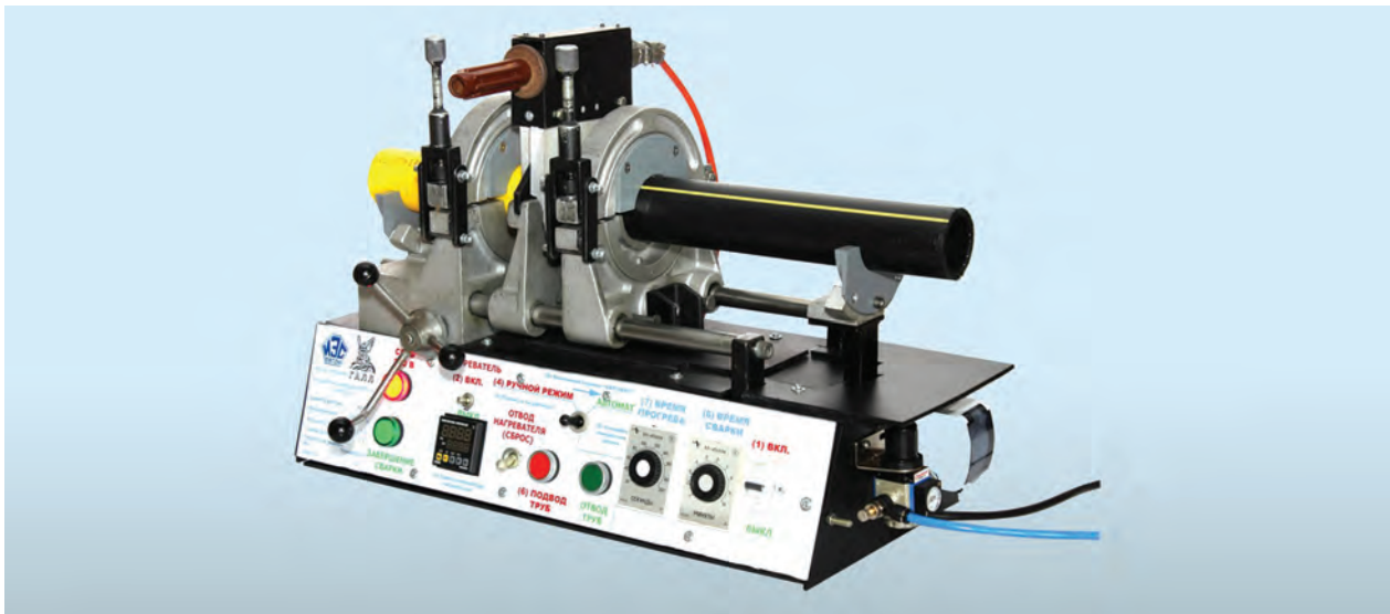
Експериментальна інноваційна зварювальна установка