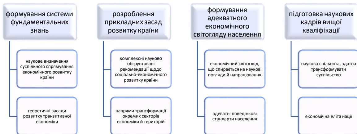
Рис. 1. Місія Відділення економіки НАН України

Відповідно Відділення організує проведення фундаментальних і прикладних економічних досліджень у підпорядкованих інститутах та установах, координує виконання досліджень найважливіших соціально-економічних процесів в усіх наукових установах країни, зокрема щодо: