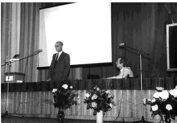
Під час доповіді