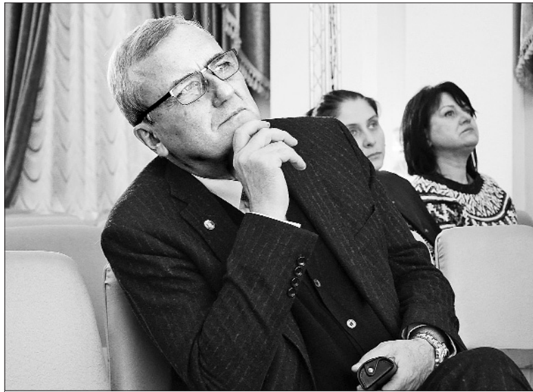
На науковій конференції

— Підняття престижу науки в державі й суспільстві є питанням майбутнього України — не буде розуміння ролі науки, не буде і поступу в економіці, не буде і зростання добробуту суспільства. Що я вкладаю в поняття підняття престижу науки в державі? Передусім