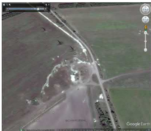
с. Весела гора. Позиції російських окупаційних військ серед курганної групи

В окремих випадках, кургани, які розташовуються на відстані від лінії зіткнення, в тому числі й на досить значній, руйнуються внаслідок облаштування опорних пунктів.