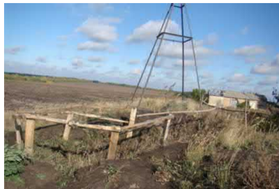
с. Дачне. Пошкодження верхівки кургану №1

В окремих випадках, кургани, які розташовуються на відстані від лінії зіткнення, в тому числі й на досить значній, руйнуються внаслідок облаштування опорних пунктів.