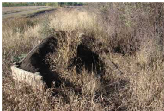
с. Дачне. Яма на кургані №3