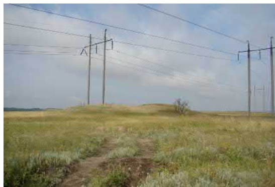
м. Лисичанськ, курганна група, уроч. Зміїне