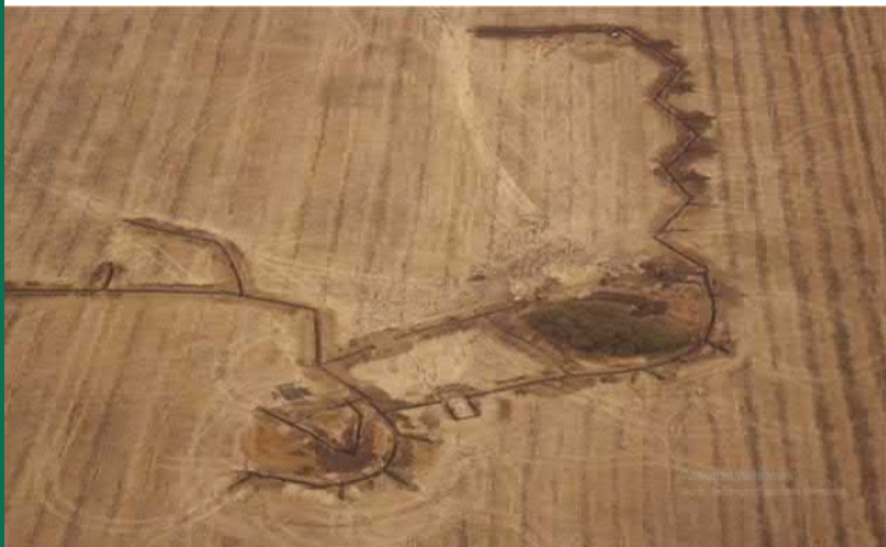
Група курганів неподалік с. Довге. Позиції російських окупаційних військ

Під час ведення військових дій воюючі сторони намагаються закріпитися на домінуючих висотах, тому основними археологічними об'єктами, які піддаються руйнації (або знищенню), є кургани (високі земляні насипи над давніми похованнями). Насипи цих давніх споруд використовують в якості оборонно-спостережних пунктів.