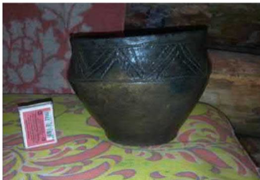
Горищик зі зруйнованого поховання між с. Лобачеве та с. Старий Айдар

Пакування. По завершенню розчистки та фіксації, виявлені знахідки необхідно зібрати у пакети, в які покласти паперові етикетки із зазначенням дати виявлення об'єкту та назви місця знаходження. Людські кістки бажано пакувати окремо від інших знахідок. Для пакування можна використовувати будь які пакети, але найкраще для цього підходять пакети для сміття та звичайні пакети з супермаркетів.