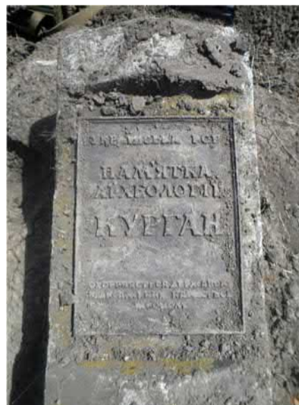
Знак «Пам'ятка археології. Курган» повалений представниками російських окупаційних військ. Донеччина.

Оскільки Україна розраховує на членство у Північно-атлантичному альянсі (НАТО), то важливо знати про те, що всі країни НАТО дотримуються чітких інструкцій в сфері захисту культурних цінностей. Війська НАТО беруть активну участь у міжнародних військових операціях і кожний з них передую методична підготовка з метою виховання у членів своїх збройних сил «духу поваги до культури та культурних надбань усіх народів».