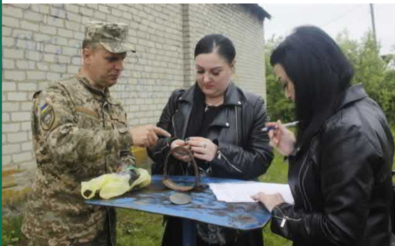
Співробітники Попаснянського районного краєзнавчого музею ім. С. Іоффе та сапер, який передав археологічні артефакти до музею

покласти загострену паличку або будь який інший предмет видовжених пропорцій. Необхідно встановити GPS координату за допомогою навігаційного пристрою (будь який смартфон має цю функцію), зробити помітки в блокноті, зошиті або за допомогою диктофону, запакувати виявлену знахідку, поклавши всередину етикетку із зазначенням місця виявлення та координати і передати командирі підрозділу або офіцеру СІМІС після попередньої домовленості із ним.