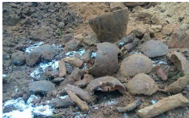
Рештки кісток та археологічних артефактів зі зруйнованого поховання між с. Лобачеве та с. Старий Айдар

підрозділу або офіцером СІМІС. Разом зі знахідками необхідно передати всю документацію з фіксації (записи, фотографії, GPS координати). У подальшому буде проведено обробку переданих матеріалів та підготовлено звіт, який буде зберігатися в науковому архіві закладу без дозволу ознайомлення до моменту зняття грифу секретності.