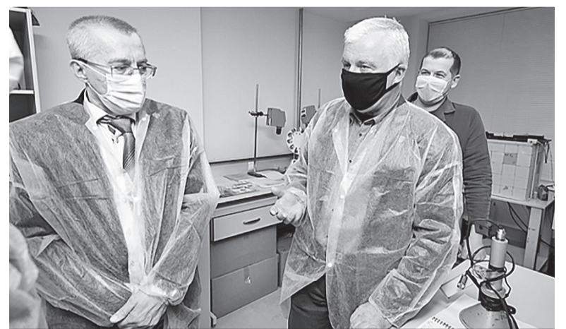
У Національному університеті біоресурсів і природокористування України

– Останнім часом ми чимало зробили для перегляду пріоритетних напрямів розвитку наукової, науково-технічної та інноваційної діяльності. У травні нинішнього року міністерство винесло на громадське обговорення проект Закону «Про основні засади формування та реалізації пріоритетних напрямів наукової, науково-технічної та інноваційної діяльності в Україні».