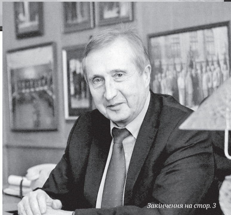
Закінчення на стор. 3

12–14 серпня в НТУУ «Київський політехнічний інститут імені Ігоря Сікорського» відбудеться важлива для всієї України подія — Х ювілейний Фестиваль інноваційних проєктів «Sikorsky Challenge 2021: Україна і світ». Про те, як зароджувалось відоме навіть далеко за межами України інноваційне середовище Sikorsky Challenge, чому саме Київський політехнічний став зачинателем і епіцентром його формування і в чому особливості нинішнього фестивалю, розповідає ректор «Київської політехніки», науковий керівник інноваційного середовища «Sikorsky Challenge», академік НАН України Михайло ЗГУРОВСЬКИЙ.