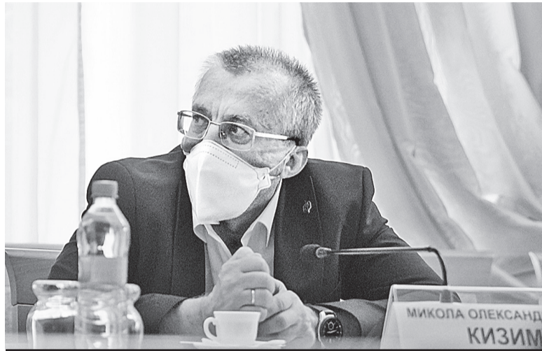
Під час наради в КПІ.

Німецькі колеги розповідали, що спочатку держава фінансувала наукові дослідження та проекти на всі 100%. Потім – на 85%, а 15% – фінансував бізнес. І аж за тридцять років науковий парк вийшов на рівень, коли бізнес вкладає 70% в його розвиток, а держава – 30%. Як бачимо, держава й зараз від своєї підтримки не відмовилася. Вона фінансує державні установи, які там знаходяться. А бізнес фінансує прикладну частину там, де доводиться до кінця науково-технічні розробки і виробляється готова продукція.