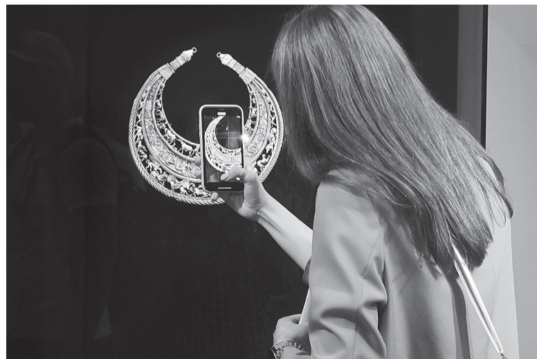
Золота пектораль. Під час відкриття виставки «Пектораль. Знахідка століття» у Музеї історичних коштовностей України.