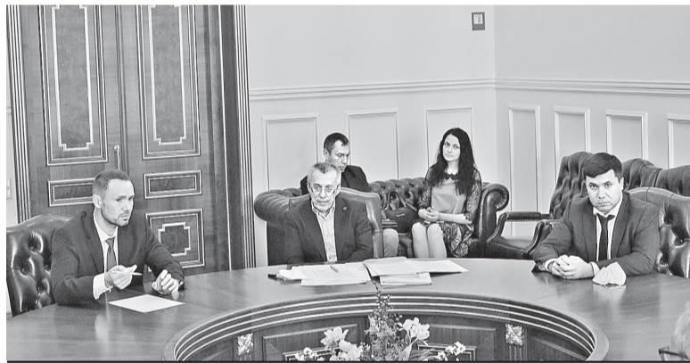
Зустріч у НАН України.

ба утримувати, інакше вони розвалиться. Тому справедливше було б молодим науковцям дати роботу, непотрібні структури – скоротити, зарплату підняти. На кошти, які вивільняться, краще нову лабораторію відкрити і молоді платити не по 10–12 тисяч гривень, а хоча б в еквіваленті тисячі доларів. Тоді вона це, може, подумає: їхати в Польщу чи вдома залишитися.