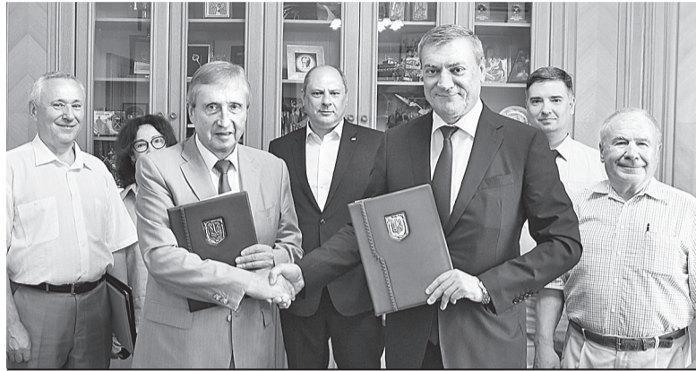
Міністерство з питань стратегічних галузей промисловості України та НТУУ «Київський політехнічний інститут імені Ігоря Сікорського» підписали Меморандум про співпрацю.

Ми підготували і подали на Верховну Раду Закон «Про науковий парк «Київська політехніка». Він поєднував інтереси чотирьох груп учасників. Насамперед, це високотехно-