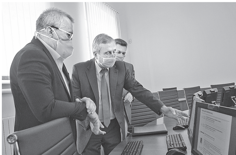
Микола Кизим у «Київській політехніці». Знайомство зі Світовим центром даних з геоінформатики та сталого розвитку.

Наука не повинна бути наукою заради науки, особливо в тому стані, в якому є наша держава. Вона має допомагати розвивати економіку, працювати на пріоритети держави, на добробут людей.