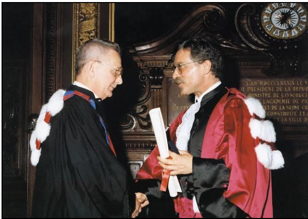
Вручення диплома почесного доктора Паризького університету

У ФТІНТі у Володимира Олександровича з'являються нові учні, серед яких два майбутні академіки НАН України — Л.А. Пастур і Є.Я. Хруслов. Водночас у його науковій творчості виникають нові теми. Низка цікавих і важливих досліджень В.О. Марченка стосуються математичної теорії дифракції. Зокрема, він запропонував метод розв'язання задач дифракції електромагнітних хвиль на періодичних структурах. Перспективність цього методу полягала в його застосуванні в усьому інтервалі довжини падаючої хвилі. Раніше використовувалися лише короткохвильові або довгохвильові наближення. Роботи, присвячені дифракції хвиль на періодичних структурах, відіграли помітну роль у розвитку теоретичних та прикладних досліджень, які проводилися в Інституті радіоелектроніки АН України під керівництвом академіка В.П. Шестопалова. Розвиток цього напрямку докладно описано у ювілейній книзі «Інститут радіофізики та електроніки ім. О.Я. Усикова НАН України. 50 років» (Харків, 2005).