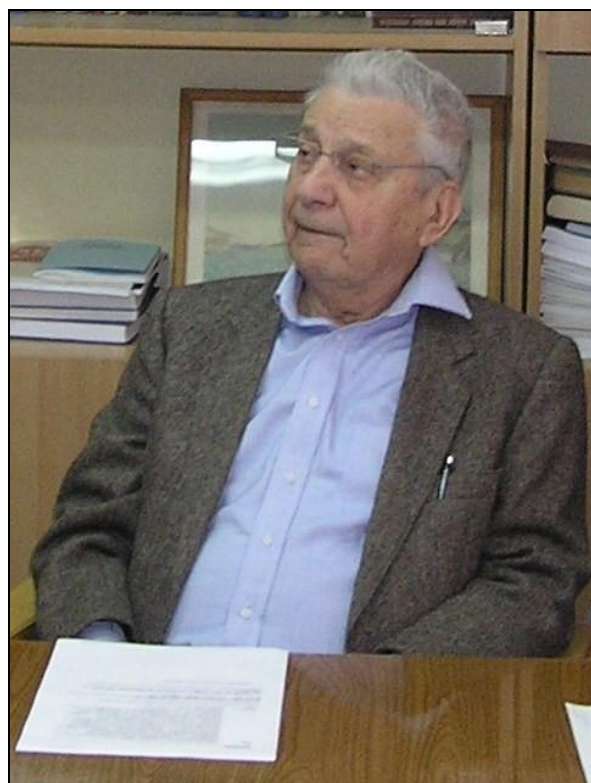
У робочому кабінеті

Для теорії солітонів характерне різноманіття підходів і методів. У 80-х роках В.О. Марченко запропонував новий метод побудови