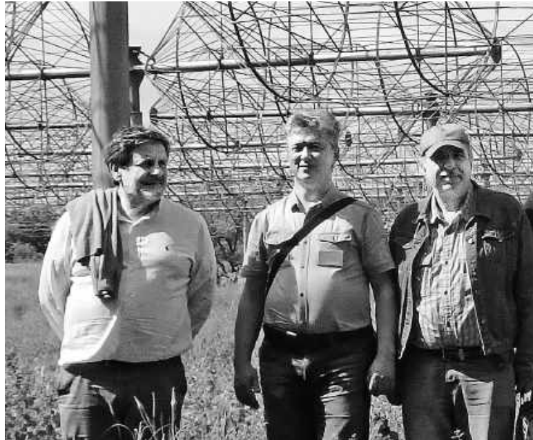
Вячеслав ЗАХАРЕНКО (посередині) з колегами, довенне фото

Як справи у науковців сьогодні? Чи в безпеці вони? Чи продовжують дослідження? Ці та інші запитання ми поставили директору РІ НАН України, члену-кореспонденту НАН України Вячеславу ЗАХАРЕНКУ.