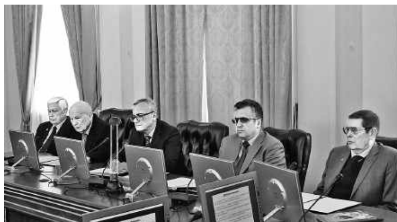
Під час обговорення

Підготував Дмитро ШУЛІКІН.