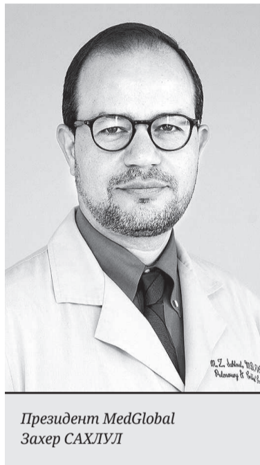
Президент MedGlobal Захер САХЛУЛ

Лікар зізнається: у той — перший — приїзд і йому, і його колегам було дуже страшно. До Львова прибували все нові й нові біженці (сотні тисяч!), у новинах розповідали про багатокілометрові черги на кордонах. У місті раз по раз «ви-