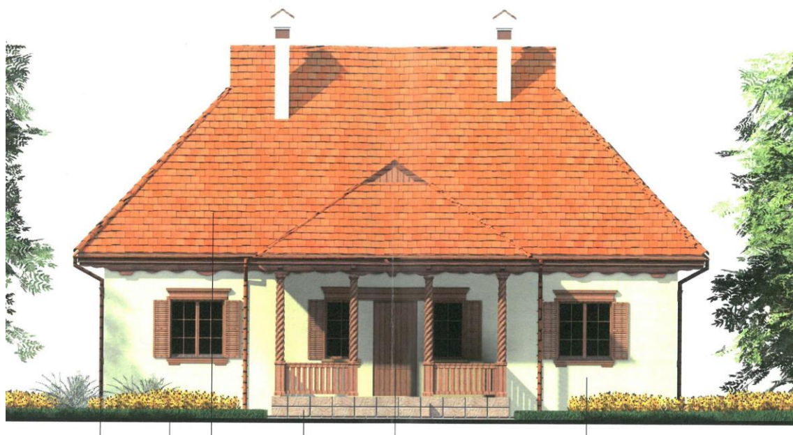
Культурно-просвітницький центр «Будинок-музей-садиба В.І. Вернадського в с.Яреськи, Шишацького району Полтавської області». СПКБ Полтавський НТУ імені Юрія Кондратюка, 2015. (арх. Конюк А.Є.)