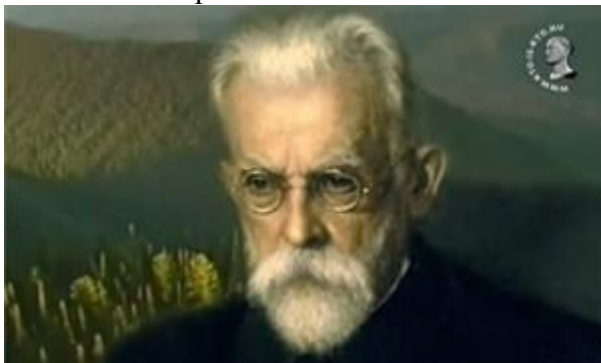
Фото: Володимир Вернадський

До 150-річчя від дня народження українського філософа, природознавця, мислителя, засновника геохімії, біогеохімії та радіогеології, космізму, академіка Володимира Вернадського, яке відзначатимуть 12 березня 2013 року, на Полтавщині планують відновити його садибу біля Шишак.