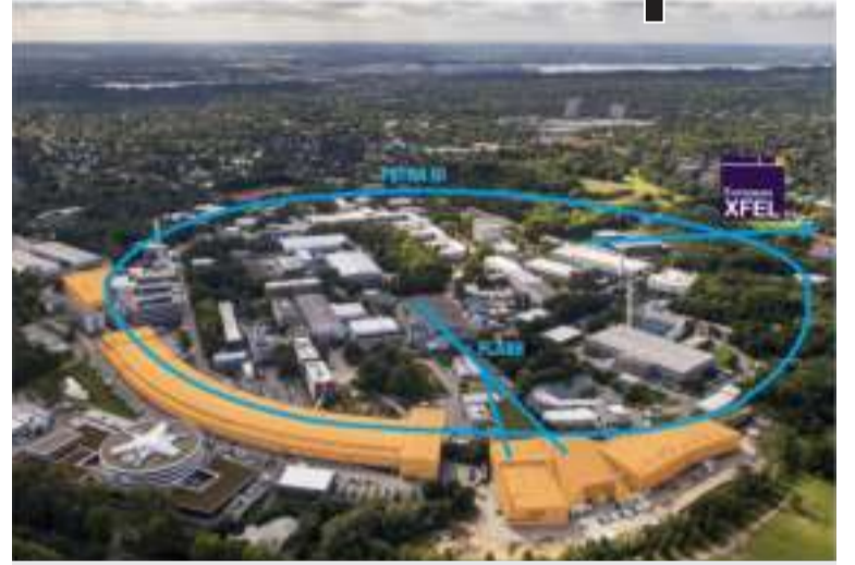
Науковці ХФТИ беруть участь в експериментах у центрі DESY

втрата енергії «напівголого» електрона у достатньо тонкій мішені помітно відрізняється від результатів, які передбачаються формулою Фермі, котра описує іонізаційні втрати частинок високих енергій.