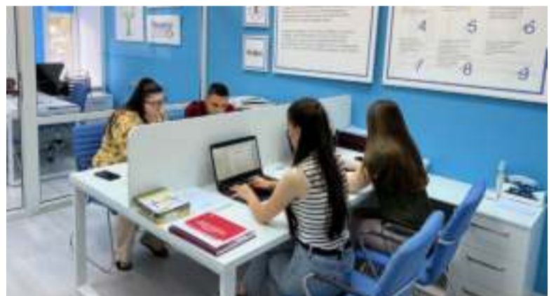
Для студентів створено всі умови для успішного навчання та наукових досліджень

Випробування і в першому, і в другому варіантах — 17–28 липня 2023 року.