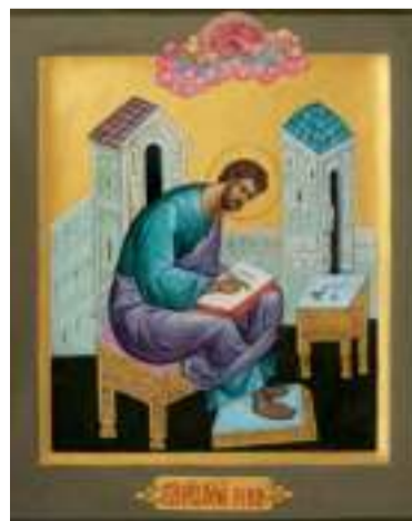
Ікона «Святий апостол і євангеліст Лука». Дошка, левкас, паволока, яєчна темпера; 35,5 x 30,5 см; 2014 р.