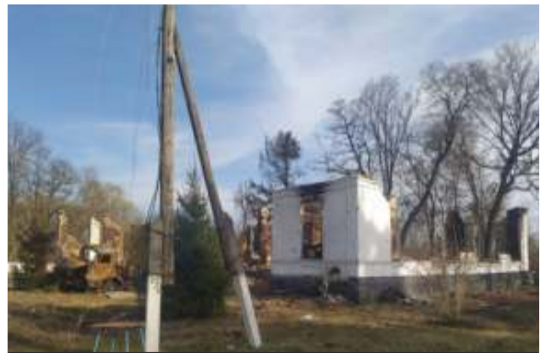
Зруйновані росіянами будинки у Новобасанській громаді.

Новгород-Сіверська громада розташована на кордоні з росією. Росіяни майже щодня обстрілюють прикордонні села. Частина снарядів не розривається, це перетворює угіддя