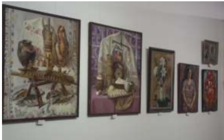
Твори необойчуків на виставці «Спадковість і новаторство», присвяченій 85-річчю з дня заснування Академії декоративно-прикладного мистецтва і дизайну імені Михайла Бойчука