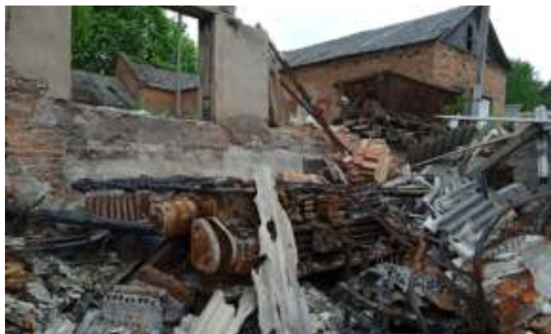
Прикордонні громади Сумщини потерпають від обстрілів з боку росії. Наслідки влучання у майстерні аграрного підприємства у Зноб-Новгородській громаді.

Багато територій навколо блокпостів та позицій російських солдатів були щільно заміновані. Лише у лісопосадці біля одного з блокпостів було виявлено близько 30 розтяжок. Території, де найчастіше