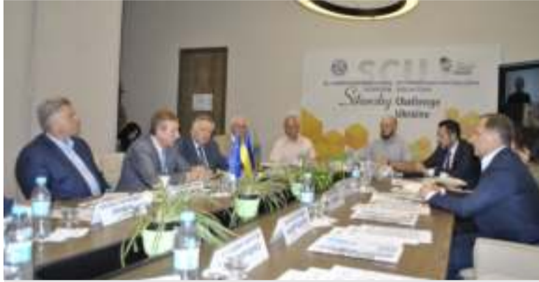
Члени Президії Української Ради Миру обговорюють Заяву УРМ та Звернення до учасників саміту НАТО у Вільносі

Українська Рада Миру ухвалила Заяву, в якій підтримала ініціативу Президента України Володимира Зеленського щодо проведення Глобального Саміту Миру та заклкала громадські організації України та демократичного світу приєднатися до неї й проявити готовність до спільних дій. Окрім того, було ухвалено Звернення до учасників саміту НАТО 11 липня 2023 року в Вільносі та до неурядових організацій країн-членів НАТО.