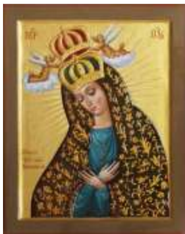
Ікона Божої Матері «Віленська». Дошка, паволока, наливний левкас, яєчна темпера; 39,3 x 31,2 см; 2015 р.

— Головний витвір мистецтва — це наше життя, і щодня воно непередбачуване, — каже Олена Осадча. — Зазвичай я пишу собі плани, і вони якось самі виконуються. Плани дисциплінують. Тому визначаю дати, на які потрібен кінцевий результат. Звісно, поєднувати творчу й викладацьку роботу складно, але намагаюся бодай раз на тиждень — у суботу чи неділю хоча б три години попрацювати пензлем. От зараз пи-