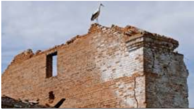
Лелека на стіні зруйнованої російською ракетною школи у Новгород-Сіверському.

Ми — група екологів і журналістів — напросилися в гості, щоб розпитати про життя за кілька кілометрів від кордону з росією та допомогти порадами у вирішенні довкіллевих питань. Петро Васильович мружиться від сонця і запрошує на чай у свій робочий кабінет.