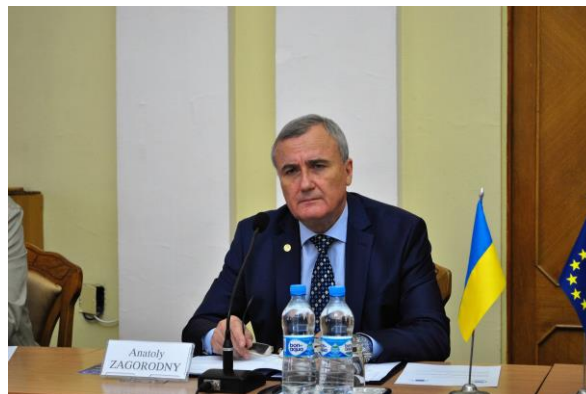
Виступ віце-президента НАН України академіка НАН України А.Г. Загороднього

У результаті було запропоновано Стратегію смарт-спеціалізацій як стратегічний напрям політики Євросоюзу, пов'язаний із забезпеченням сталого розвитку всіх країн ЄС та можливості своєчасного ефективного реагування на соціальні виклики на основі широкого використання новітніх технологій та інновацій і міжнародного розподілу праці в межах ЄС. Стратегія S3 реалізується через відповідну платформу – набір підходів, інструментів і засобів підтримки інновацій, які забезпечують досягнення поставленої мети – розвиток економіки та гнучке реагування на різноманітні виклики.