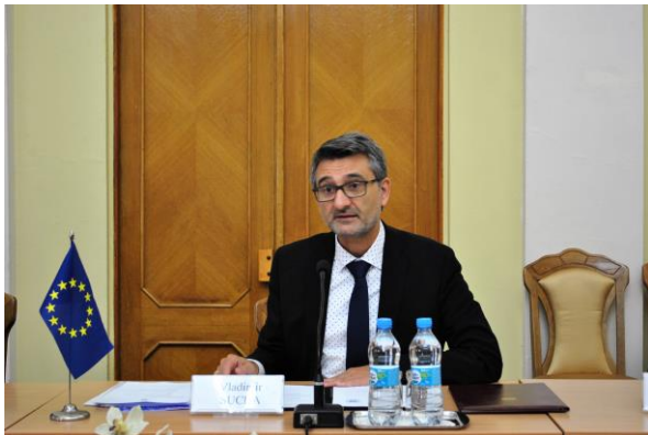
Виступ генерального директора Гендиректорату Об'єднаного дослідницького центру Європейської комісії доктора Владіміра Шуخی

Одним з основних завдань JRC є виявлення особливостей і труднощів, з якими стикаються і науковці, і політики. Наприклад, це недостатня кількість мультидисциплінарних напрямів, бо ізольовані наукові дисципліни не можуть подолати виклики сучасного світу. Для цього потрібно залучати потенціал різних наук, у тому числі суспільних і гуманітарних. Дедалі важливішими стають етичні проблеми: недобросовісні або навіть підроблені результати, плагіат, псевдонаукові погляди тощо. Ці явища руйнують довіру суспільства до науки, але найгірше, що самі вчені часто ставляться до них байдуже чи поблажливо, тоді як про такі проблеми слід говорити вголос і вирішувати їх насамперед силами самої наукової спільноти.