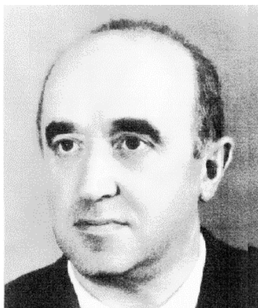
Академік А.К. Бабко

У різні часи редакційну колегію видання очолювали такі відомі науковці, як один із засновників колоїдної хімії академік АН УРСР, член-кореспондент АН СРСР А.В. Думанський (1948-1953 рр.), відомий хімік-органік, фахівець із кардинальних питань теорії перетворень органічних сполук академік АН УРСР Є.О. Шилов (1953-1958 рр.), фахівець у галузі аналітичної хімії та хімії комплексних сполук академік АН УРСР А.К. Бабко (1905-1968), основоположник радянської школи фізичної хімії та електрохімії розплавлених солей академік АН УРСР Ю.К. Делімарський (1968-1988 рр.), фахівець із проблем електрохімічної кінетики, хімії та електрохімії йонних розплавів і водних розчинів, електрохімічного захисту металів академік АН УРСР О.В. Городиський (1988-1993).