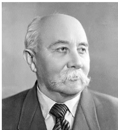
Академік А.В. Думанський

До складу першої редакційної колегії УХЖ входили академіки АН УРСР Л.В. Писаржевський, Є.І. Орлов, В.О. Плотніков, члени-