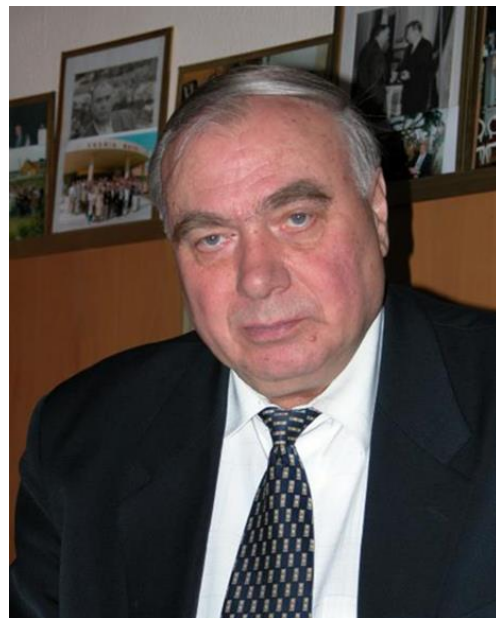
Академік С.В. Волков

УХЖ – перше та єдине в Україні широкопрофільне хімічне наукове періодичне видання – публікує оригінальні оглядові статті з теоретичних і прикладних проблем сучасної хімії – передусім таких її розділів, як неорганічна та фізична хімія, електрохімія, аналітична хімія, хімія органічних і високомолекулярних сполук. У межах вказаних розділів журнал подає статті з проблем фізико-неорганічної хімії, хімії координаційних сполук, високо- й середньотемпературної фізичної хімії та електрохімії, супрамолекулярної хімії, нанохімії, екологічної (так званої «зеленої») хімії, а також хімії функціональних неорганічних, органічних і полімерних матеріалів.