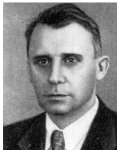
Академік С.О. Шилов

1948 року журнал почав видаватися Академією наук УРСР на базі київського Інституту загальної та неорганічної хімії (ІЗНХ). Його було об'єднано з журналом «Записки Института химии АН УССР» (виходив друком з 1934 року), від якого УХЖ успадкував усі найкращі традиції, а також талановитих співробітників – представників наукових шкіл академіків АН УРСР В.О.Плотнікова й А.В.Думанського – В.О. Ізбекова, Я.А. Фіалкова, А.К. Бабка, Ю.К. Делімарського, Ф.Д. Овчаренка та інших.