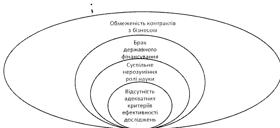
Рис. 2. Взаємозв'язки основних загроз ефективній роботі Відділення економіки НАН України

Через взаємопов'язаність головних ризиків і загроз (рис. 2) посилення однієї складової спричиняє зростання імовірності реалізації і вплив другої, але пом'якшення однієї далеко не автоматично зменшує значення другої.